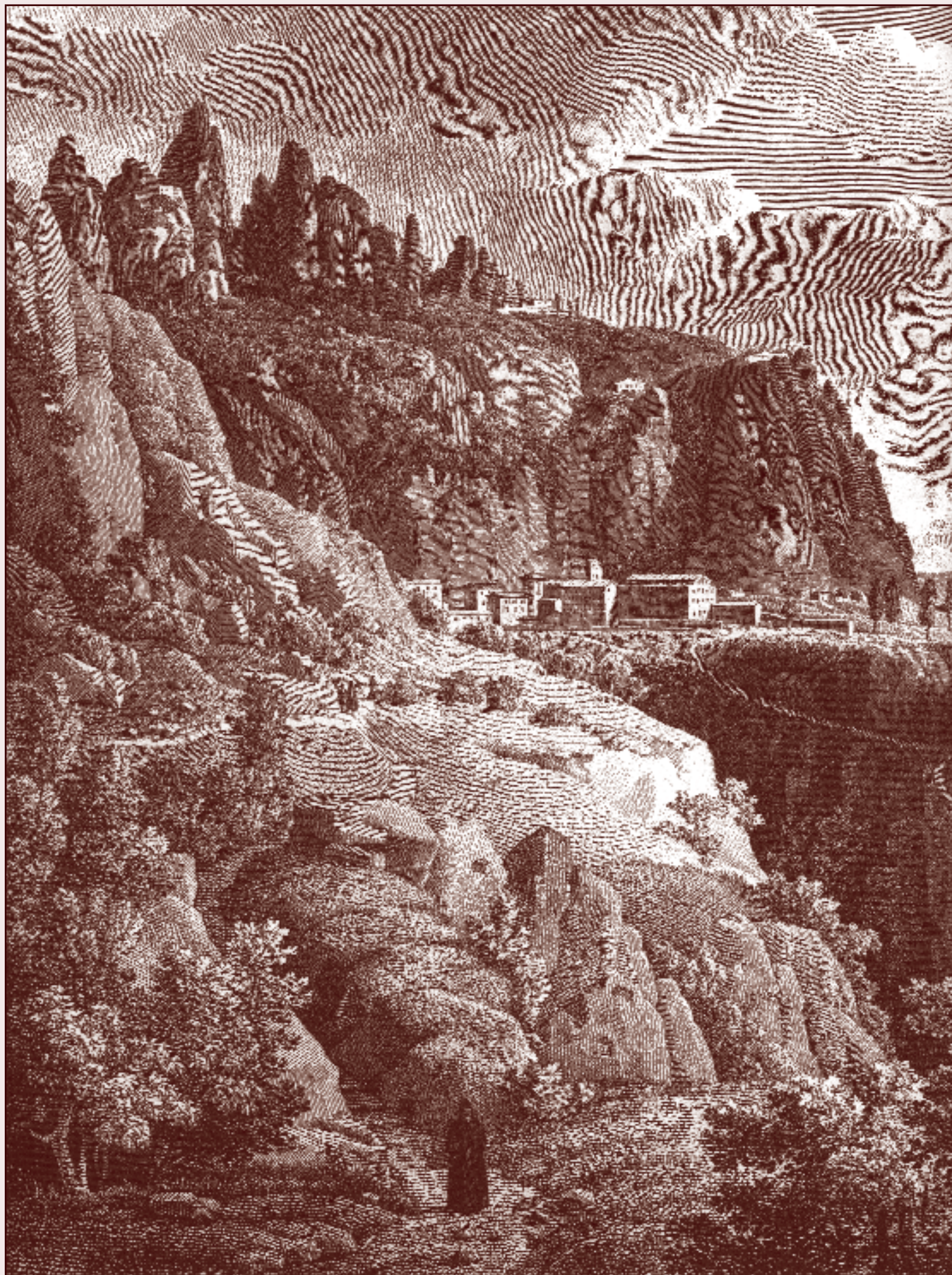
Vista de les ermites de la Tebaida i del monestir de Montserrat, en un gravat del Voyage pittoresque et historique de l'Espagne (1806), d'Alexandre de Laborde.