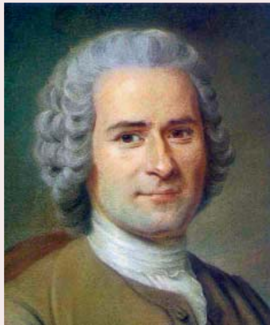
Jean-Jacques Rousseau, un dels més grans pensadors del segle XVIII, en un retrat de Maurice-Quentin de la Tour: M. Rousseau, ciotoyen de Genève (1753).