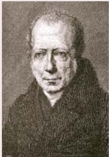
Retrat de Wilhelm von Humboldt. (Dibuix de Joseph Schmeller).

Imagineu un home del nord com Humboldt, avesat a veure les altes muntanyes dels Alps. Avesat a veure cims nevats, glaceres, planells lacustres i boscos d'avets. Avesat a veure la muntanya en el seu