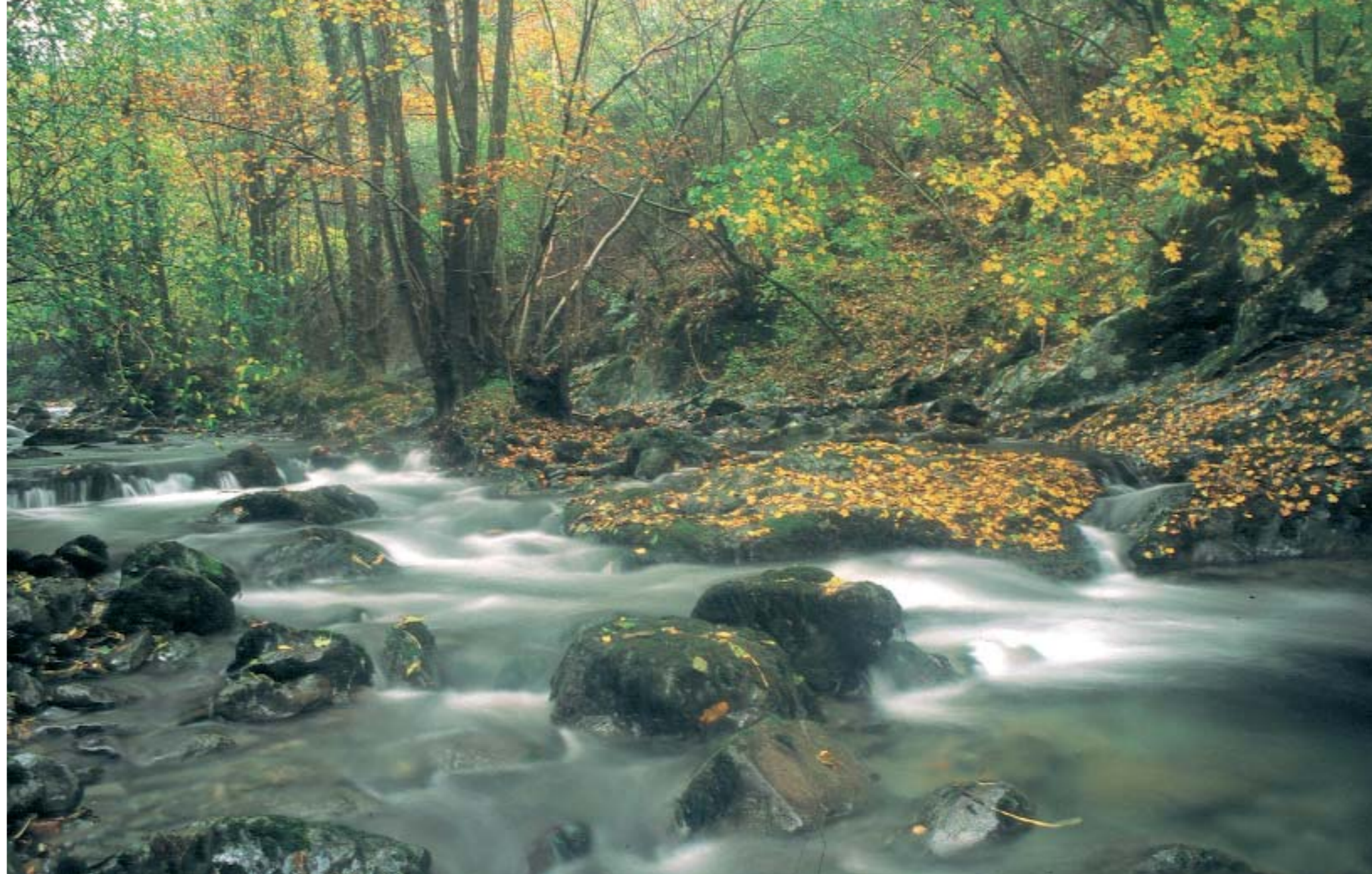
REYNO DE NAVARRA

L'any 1926 el novel·lista nord-americà Ernest Hemingway va publicar The Sun Also Rises , considerada la seva primera obra d'importància. És una història d'un grup de nord-americans i britànics que vagaren per Espanya i França, membres de l'anomenada generació perduda . Una bona part de l'obra succeeix a les festes dels sanfermines de Pamplona. Però també els naturals de les valls pirinenques saben el ressò que va tenir la presència de Hemingway, sobretot al bosc d'Irati, del qual en va quedar fascinat. L'autor, des del seu hostel de Burguete, buscava el curs del riu Irati per pescar-hi truites, per descansar i per gaudir de la natura singular d'aquest indret.