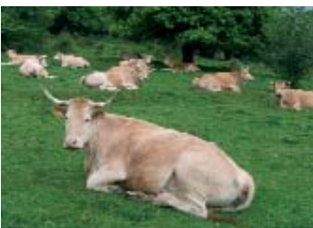
A dalt, el poblet d'Isaba. A sota, un grup de vaques pasturant a prop d'Azpegui.

Pel que fa al pic de l'Ori (2.012 m) cal notar que apareix per damunt del bosc d'Irati d'una manera molt espectacular. Per a més informació sobre l'Ori (Ohri) consulteu l'article de Luis Alejos publicat a Muntanya 873: 14-19.