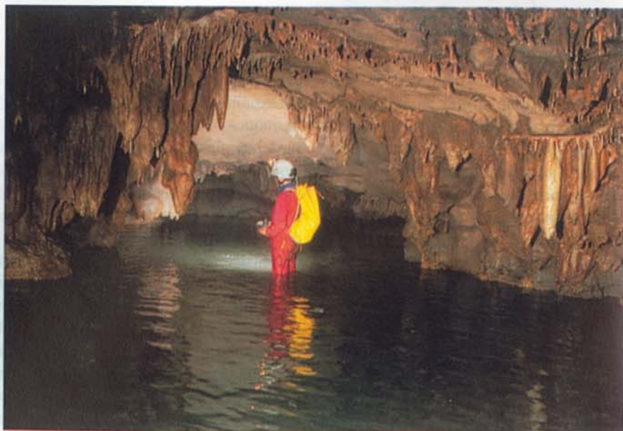
Hi ha trams en què el riu Almirante cobreix la base de les galeries de la Cueva del Fun Fun.

En els anys 1991-1992 es dué a terme un altre treball de camp, també al parc dels Haitises, a cura de la Sociedad Espeleológica Geos, de Sevilla, durant tres campanyes, i amb un total de més de trenta-nou cavitats topografiades. Publicat en les Actas del VI Congreso Nacional de Espeleología . Pel que sa-