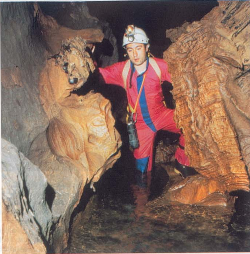
Remuntant el curs ascendent i vigorós del riu Almirante, en el seu pas subterrani per la Cueva del Fun Fun.

pot superar-se amb bastant facilitat si es disposa d'un bidó per a flotar, ja que convé nedar d'una tirada per aigües que presenten una profunditat de 7 m en el seu punt més baix. Un cop superat el llac, la cavitat continua el curs ascendent, i cada cop més vigorós, del riu Almirante, i culmina amb un sífo terminal o bé en una galeria taponada per materials. Hi ha algunes galeries limítrofes al curs del riu que segueixen camins paral·lels o bé fan alguns revolts fins que moren, les quals destaquen per la seva sequedat.