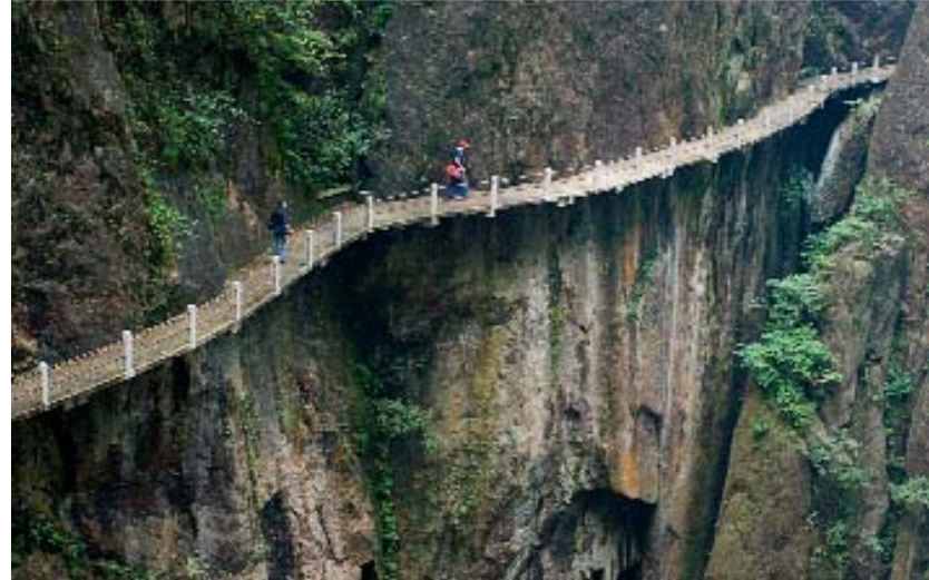
Camí del Gran Canyó de Xi Hai.

(oest), a pocs minuts, es troba Baiyun Bin Guan ('hotel dels núvols blancs'), i l'entrada a Xi Hai ('mar de núvols de l'oest'). Des d'aquest hotel surt una de les rutes més increïbles de Huang Shan. Fa pocs anys que s'ha arreglat i s'ha tornat a obrir al públic. Recorre l'anomenat Gran Canyó de Xi Hai, dins de l'àrea paisatgística del mar de l'oest. Huang Shan es divideix en diferents zones paisatgístiques: la del 'paravent de jade', on hi ha els cims de la Flor de Lotus i de la Capital del Cel; la de la mar celestial, la zona central, amb l'hotel dels núvols blancs, i la del mar de l'oest, on hi ha el Gran Canyó, a més la del mar del nord i la de les fonts termals, que es descriuran més endavant.